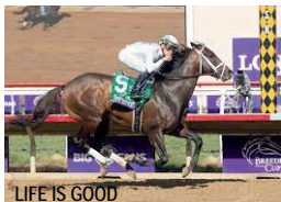
LIFE IS GOOD